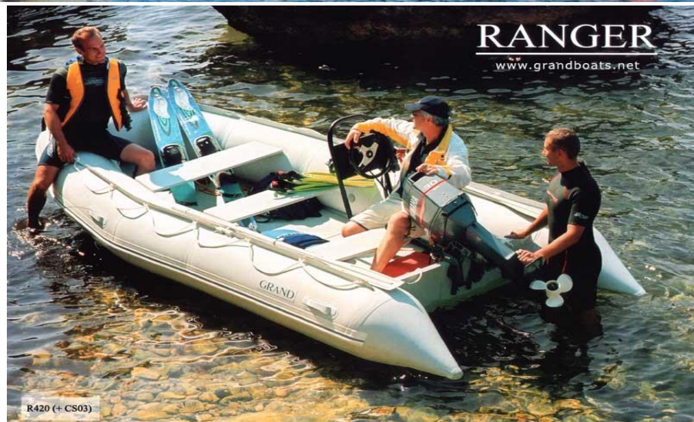
R420 (+ CS03)